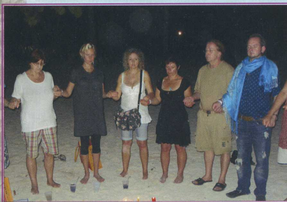
Gemeinschaft erleben in der Karibik

Wir kamen erst spät am Abend an. Am nächsten Tag trafen wir uns alle in der Lobby und unsere Entdeckungsreise ging los. Die Gruppe hat die Anlage und die karibische Umgebung kennengelernt, sodass wir mit dem Seminar relaxt